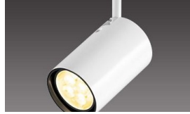
スポットライト設置