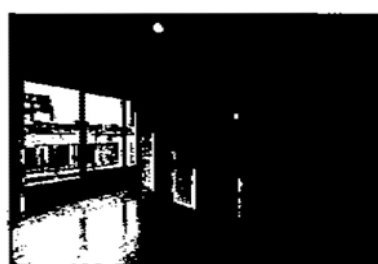
3階洋室2つ・可動式間仕切タイプ