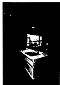
トリプルワイドのIHクッキングヒーター ウォシュレットトイレは2ヶ所