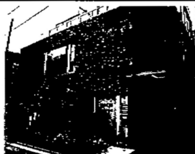
安心の低層デザイナーズマンション