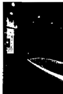
フルオートバス・浴室乾燥機付